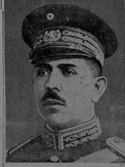
Sensacional MEXICO, 12. — Han causado inmensa sensación los rumores insistentes que circulan en todos los centros políticos, de que el Presidente Cárdenas va a ser obligado a renunciar a consecuencia de la advertencia hecha por el Presidente Calles de Pasa a la página 4

Esta tarde recogimos otros informes acerca de este movimiento en pro de la candidatura del señor Beeche. Una persona que ha estado muy al tanto de todas esas actividades nos aseguró que hasta el momento, en la mañana de hoy, habían suscritos noventa y tres mil colonos para iniciar la campaña. Esa persona nos manifestó que había tenido en sus manos esa lista donde un grupo de capitalistas suscribían la expresada cantidad para apoyar el movimiento a favor del señor Beeche. También se nos manifestó que aunque el Licenciado don Alfredo González Flores apoyaba la candidatura del señor Beeche, se negaba a que su nombre fuera tomado en cuenta para la primera designatura a la Presidencia.